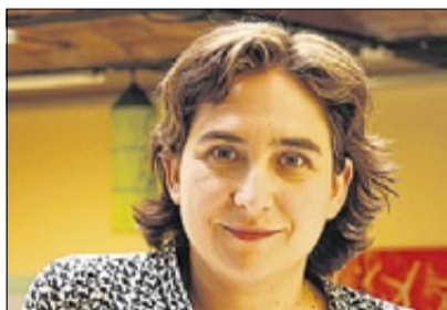
ADA COLAU PORTAVOZ DE LA PAH

«Es incongruente proteger a un feto discapacitado y cortar drásticamente las prestaciones para la dependencia. Tener un hijo no querido puede causar enfermedades psicosomáticas. Quien aborta, es que no tiene otra salida».