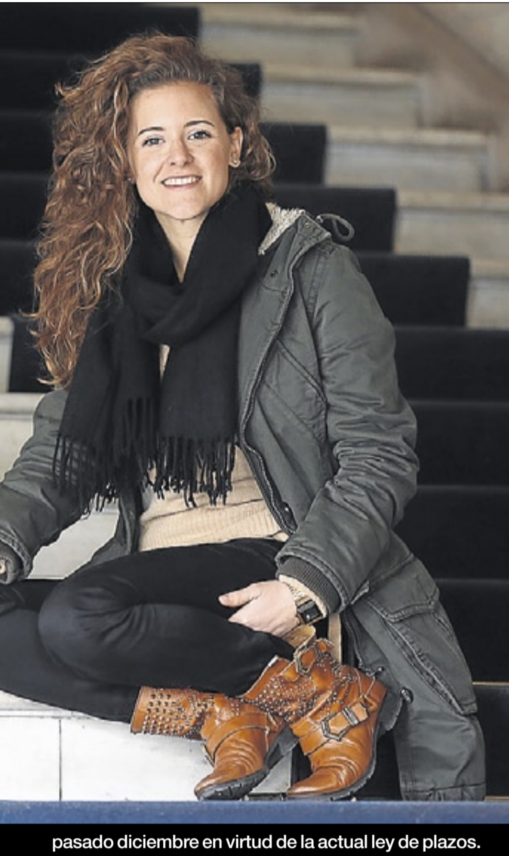
pasado diciembre en virtud de la actual ley de plazos.