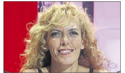
CARME CONESA ACTRIZ