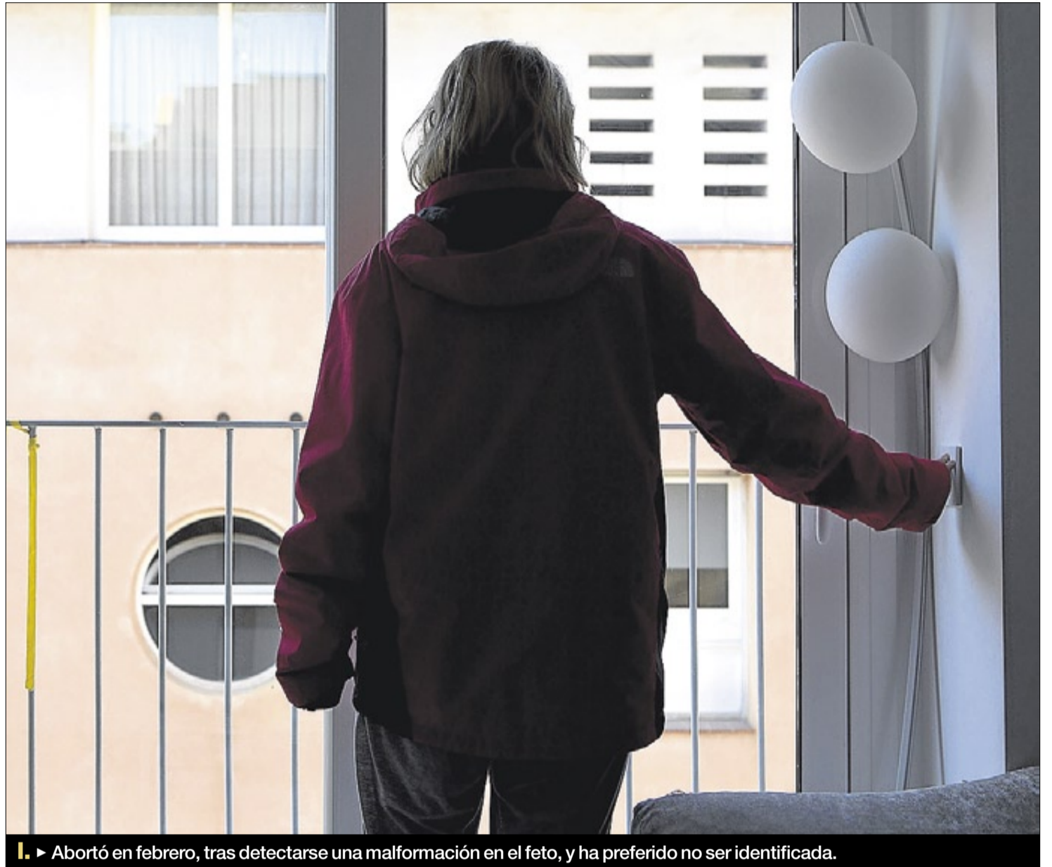
► Abortó en febrero, tras detectarse una malformación en el feto, y ha preferido no ser identificada.

solo prevé dos posibilidades legales de abortar: un grave peligro para la salud física o psíquica de la mujer y que el embarazo sea consecuencia de un delito contra la libertad o la seguridad de la mujer. Un supuesto menos que los tres de la ley de 1985, la primera de la democracia y antes-cursora de la actual de plazos, con la que manipuladoramente compara su reforma Mariano Rajoy.