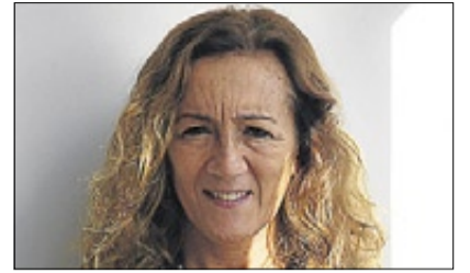
CARME PORTACELI DIRECTORA TEATRAL