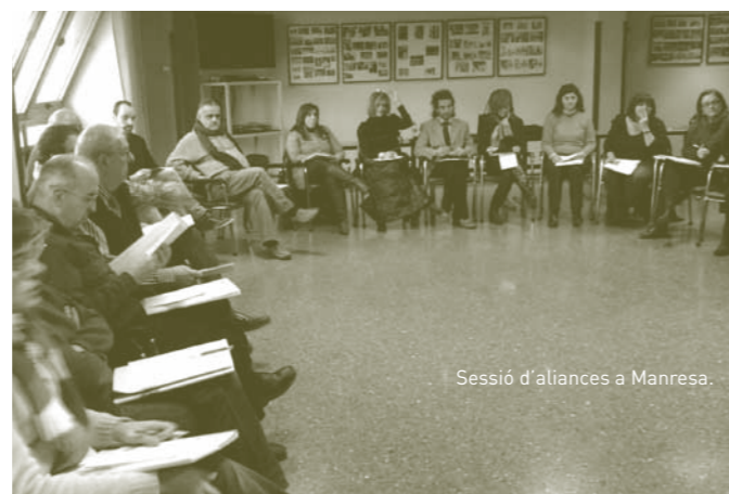
Sessió d'aliances a Manresa.

Una vintena d'entitats i institucions manresanes participen entre els mesos de gener i març en tres focus group organitzats per ECAS per promoure les aliances a la ciutat a partir de la Xarxa per a la Inclusió Social de Manresa. Les sessions formen part d'un conveni d'ECAS amb la Diputació de Barcelona.