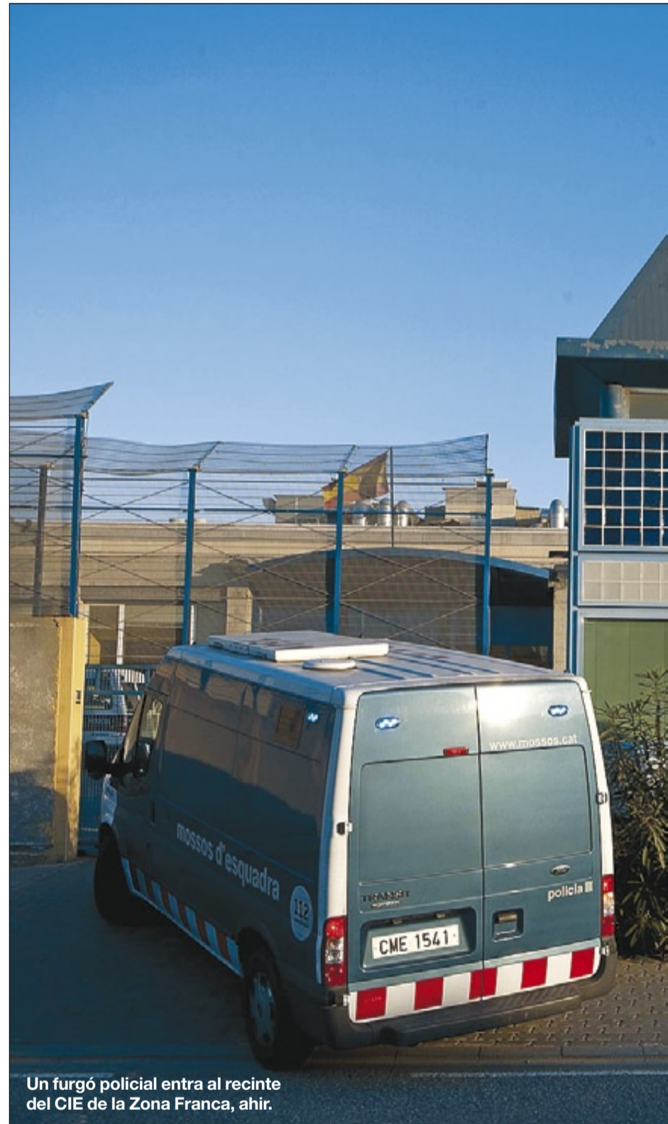
Un furgó policial entra al recinte del CIE de la Zona Franca, ahir.

Videocomentari de Toni Sust a http://www.e-periodico.cat