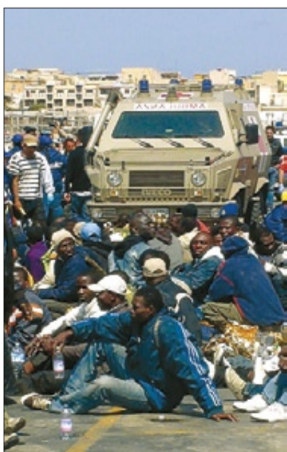
►► Refugiats a Lampedusa, el mes d'abril passat.

Itàlia té 13 dels denominats centres d'identificació i expulsió, amb una permanència màxima de 180 dies que el 2011, durant les revoltes al nord d'Àfrica, el Govern va allargar fins a 18 mesos. Depenen de les subdelegacions del Govern. Una comissió parlamentària els ha definit com a «estructures penitenciàries» i Metges sense Fronteres ha dit que són «totalment inadequats per poder contenir persones de forma vivible», i ha subratllat l'ús que els interns fan d'ansiolítics. A més, recorren sovint a protestes violentes. ROSEND DOMÈNECH