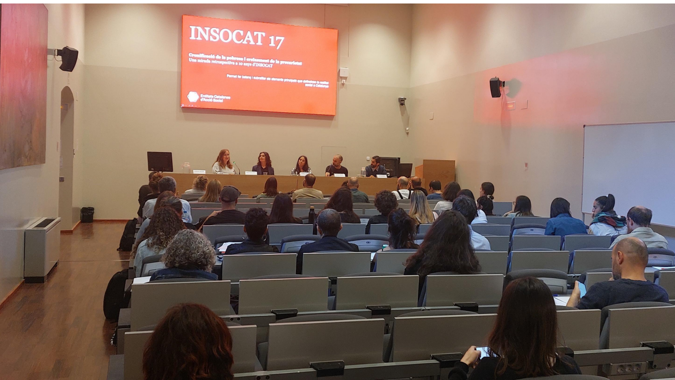
Fotografia 4 | Pla general de la sala d'actes en el moment d'iniciar la taula rodona.