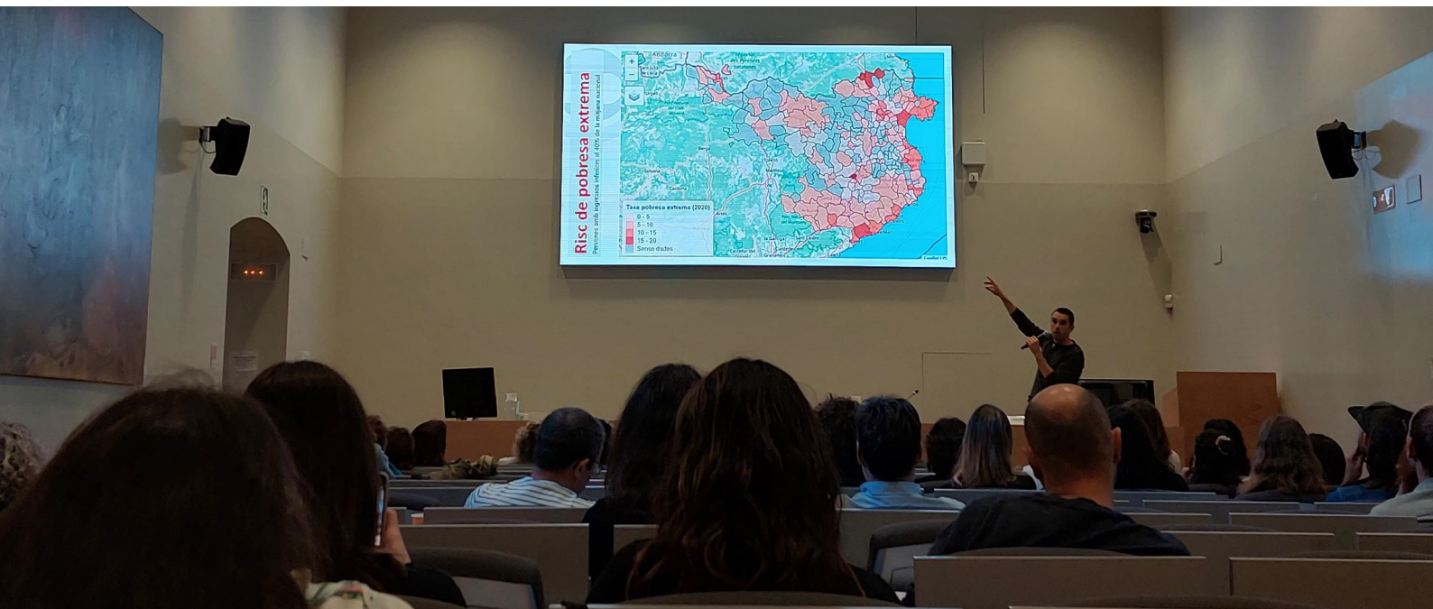
Fotografia 2 | Narcís Pou, tècnic de Dipsalut, exposant dades del risc de pobresa extrema.

Una altra de les problemàtiques per obtenir dades a la província de Girona és que el 85% dels municipis tenen menys de 1.000 habitants i això fa que, en alguns casos, s’entri en conflicte amb la política de privacitat i protecció de dades. Aquest fet esdevé altament perjudicial perquè impedeix aconseguir dades de municipis i per aquest motiu, sovint moltes dades se segmenten per regió sanitària, comarca o província, però no per municipi.