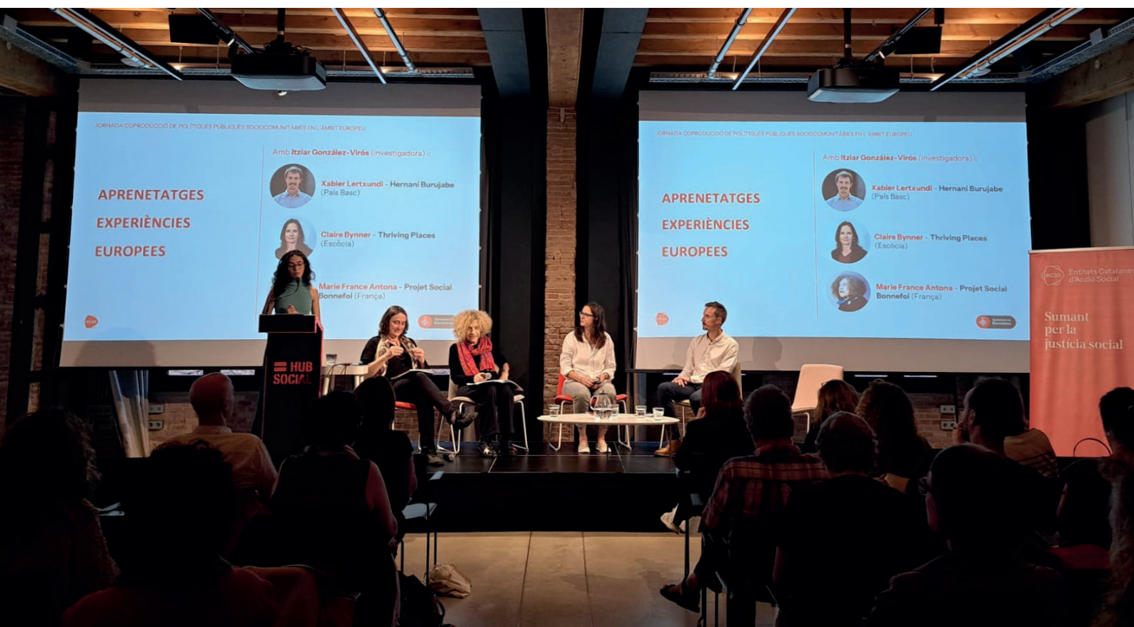
Pla general de la Taula d'aprenentatges i experiències europees.

En aquest sentit, l'Acord Ciutadà per una Barcelona Inclusiva apareix com un exemple d'espai on es comparteixen itineraris d'acció, capaç de mantenir estratègies a mitjà i llarg termini. Una experiència inspiradora que, des de l'àmbit local, genera múscul ciutadà i construeix vincles. Per a Gomà, les bones pràctiques de reforç del teixit comunitari són la clau perquè el nou contracte ecosocial que necessitem, al centre del qual hi ha d'haver la lluita contra les desigualtats, no quedi en paper mullat. El pacte “només té sentit si existeix la capacitat per concretar-lo” i els agents protagonistes han de ser les administracions públiques i la ciutadania, organitzada a través del teixit associatiu i les xarxes comunitàries. Els contextos de construcció de comunitat —pels quals els poders públics han d'apostar amb polítiques arrelades al territori— són un dels tres eixos per generar una resposta a l'alçada del repte que afrontem, junt amb la democratització dels processos de producció i la innovació .